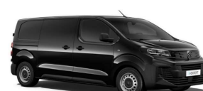
9VM0 - Črna Perla Nera