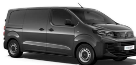
1JM0 - Siva Titanium