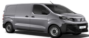
F4M0 - Siva Artense