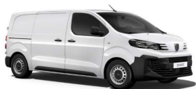
PRP0 - Bela Icy