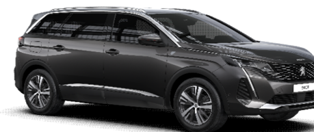
VLM0 - SIVA PLATINUM