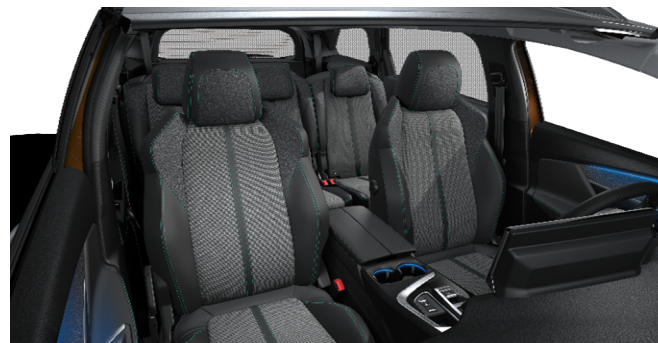
48FQ - Notranjost iz TEP / tkanina 'Colyn' serijsko na Allure Pack