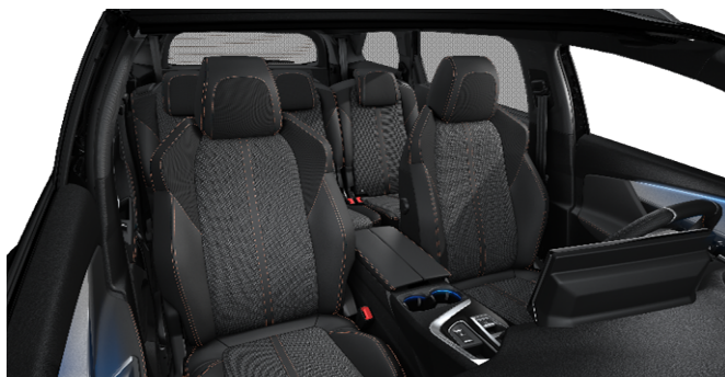
73FH - Notranjost iz TEP / tkanina 'Belomka' serijsko na GT