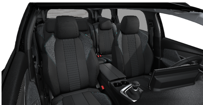
V1FX - Notranjost iz tkanine 'Meco' Mistral serijsko na Active Pack