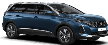
SYM0 - MODRA CELEBES