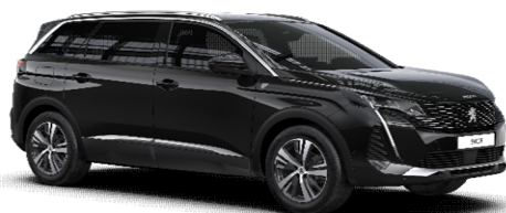
9VM0 - ČRNA PERLA NERA