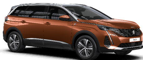
LGM0 - BAKRENA COPPER