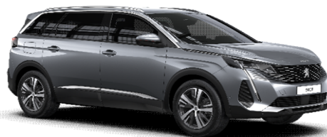
F4M0 - SIVA ARTENSE