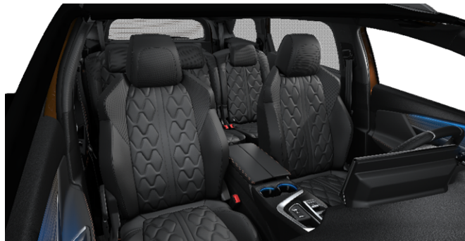
8DFX - Notranjost iz usnja 'Nappa' Mistral opcija na Allure Pack in GT