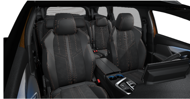
0JFI - Notranjost iz TEP / alkanbara 'Glanon' opcija na GT