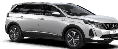
N9M6 - BELA NACRE