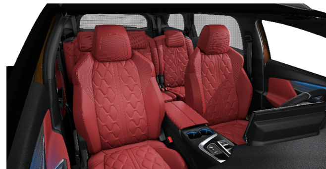
8DFJ - Notranjost iz usnja 'Nappa' Rdeča opcija na GT