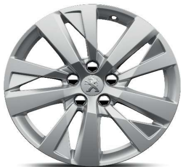
Serijsko na nivoju opreme ACTIVE PACK 17'' ALU platišča 'CHICAGO'