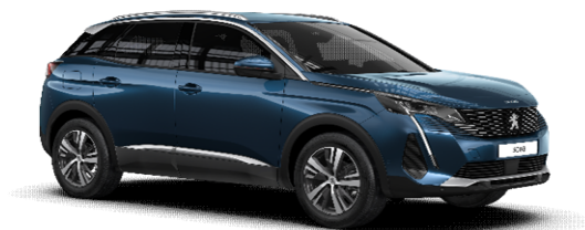
SYM0 - MODRA CELEBES