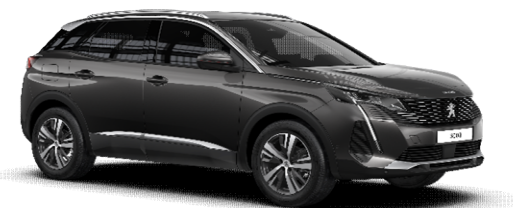
VLM0 - SIVA PLATINUM