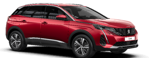
F3M5 - RDEČA ULTIMATE