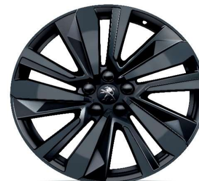
Opcija na nivoju opreme GT 19'' ALU platišča 'WASHINGTON'