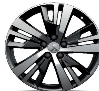
Serijsko na nivoju opreme GT 18'' ALU platišča 'DETROIT' (Noir Onxy Brilliant)