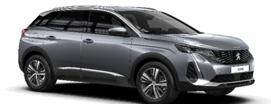
F4M0 - SIVA ARTENSE