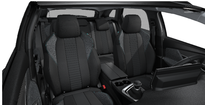
V1FX - Notranjost iz tkanine 'Pneuma' Mistral serijsko na Active Pack