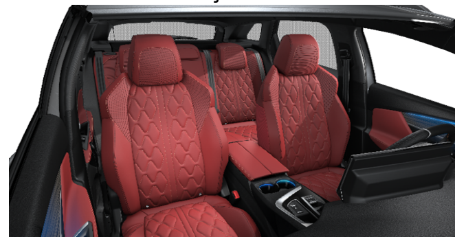
8DFJ - Notranjost iz usnja 'Nappa' Rdeča opcija na GT