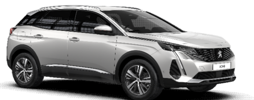
N9M6 - BELA NACRE