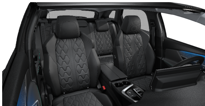
8DFX - Notranjost iz usnja 'Nappa' Mistral opcija na Allure Pack