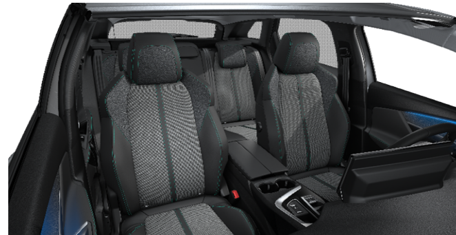
48FQ - Notranjost iz TEP / tkanina 'Colyn' serijsko na Allure Pack