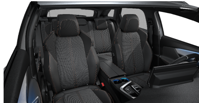
73FH - Notranjost iz TEP / tkanina 'Belomka' serijsko na GT