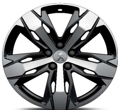
Opcija na nivoju opreme ALLURE PACK GT 18'' ALU platišča 'LOS ANGELES'