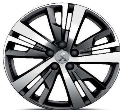
Serijsko na nivoju opreme ALLURE PACK 18'' ALU platišča 'DETROIT' (Gris Storm Brilliant)