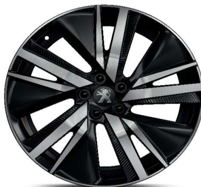
Opcija na nivoju opreme GT 19'' ALU platišča 'SAN FRANCISCO'