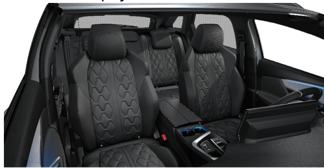
8DFX - Notranjost iz usnja 'Nappa' Mistral opcija na GT