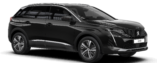
9VM0 - ČRNA PERLA NERA