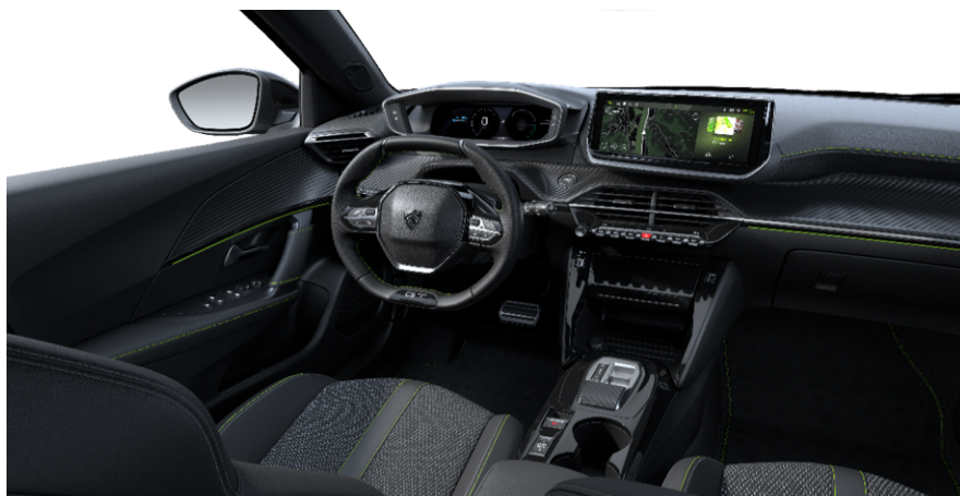
ATFX - Kombinaciji TEP usnja in tkanine Belomka serijsko na e-GT