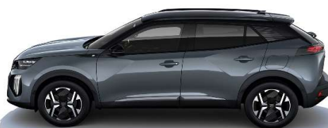
LDM0 - SIVA SELLENIUM