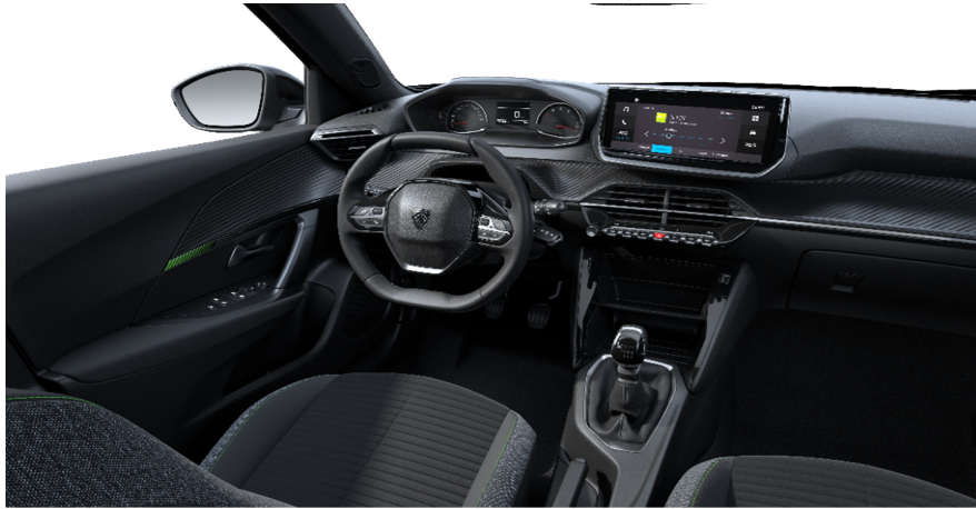
APFX - Tkanina Pneuma serijsko na Active