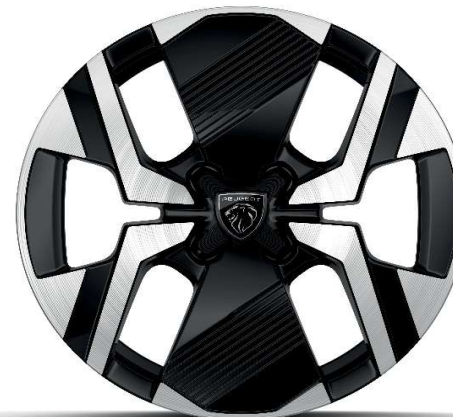
17" ALU platišča 'KARAKOY' serijsko na Allure in GT