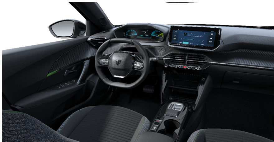
APFX - Tkanina Pneuma serijsko na e-Active