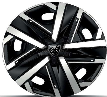
16" jeklena platišča z okrasnimi pokrovi 'SILOM' serijsko na Active