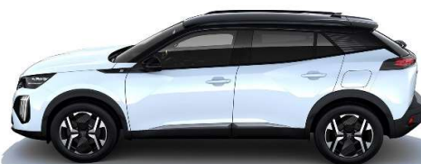
SUM0 - BELA OKENITE