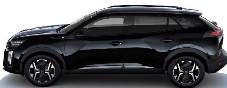
9VM0 - ČRNA PERLA NERA