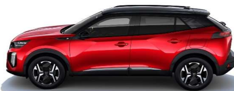
VHM5 - RDEČA ELIXIR