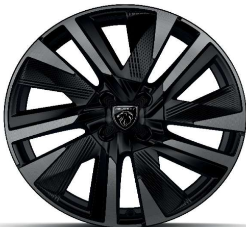
18" ALU platišča 'EVISSA' opcija na GT