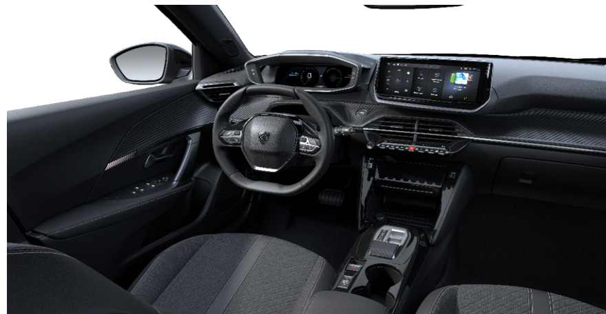
AQFX - Kombinaciji TEP usnja in tkanine Lomsa serijsko na e-Allure