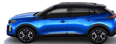
SMM6 - MODRA VERTIGO