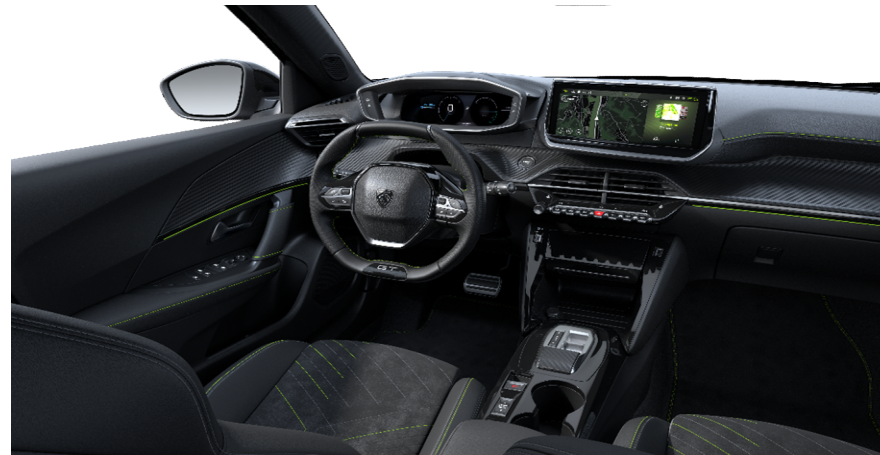
WNFX - Kombinaciji TEP usnja in alkantare opcija na e-GT